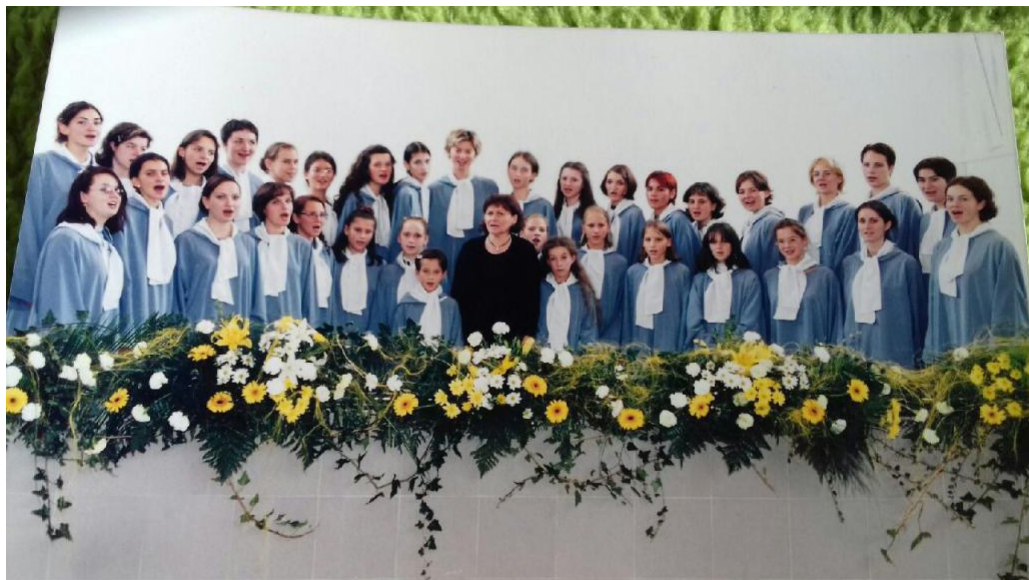
Holúbky z Kríža spievali pri príležitosti vysvätenia Kostola Sedembolestnej Panny Márie 22.9.2001

Vieme, že v pokore, skromnosti a službe Pánovi nečakajú Holúbky na ódy uznania. Napriek tomu vám chceme vyjadriť hlboký obdiv a vďaka za vašu bohumilú činnosť. Vyprosujeme vám silu a Božiu milosť pre ďalšie tvorivé roky. Prajeme si ešte dlhú dobu prežívať svätú omšu v spojení s týmto výnimočným sprievodom, ktorý umocňuje stretnutie so živým Ježišom a krásnym darom z nebies.